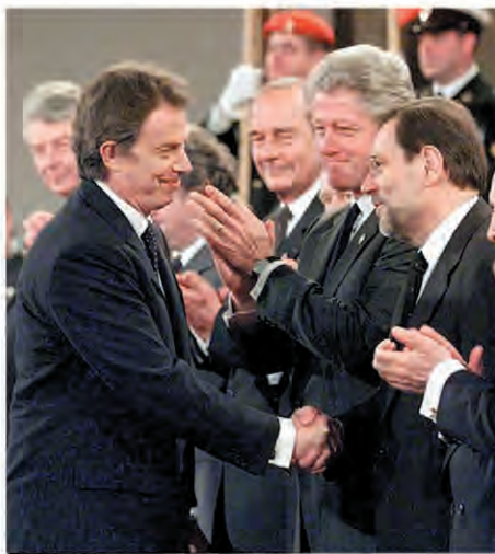
Tony Blair, Jacques Chirac, Bill Clinton et Javier Solana au quatuor des hommes forts de l'OTAN.

Vendredi, dans leur déclaration sur le Kosovo, les dix-neuf, unanimes, ont décidé d'un blocus sur le pétrole à destination de la You-