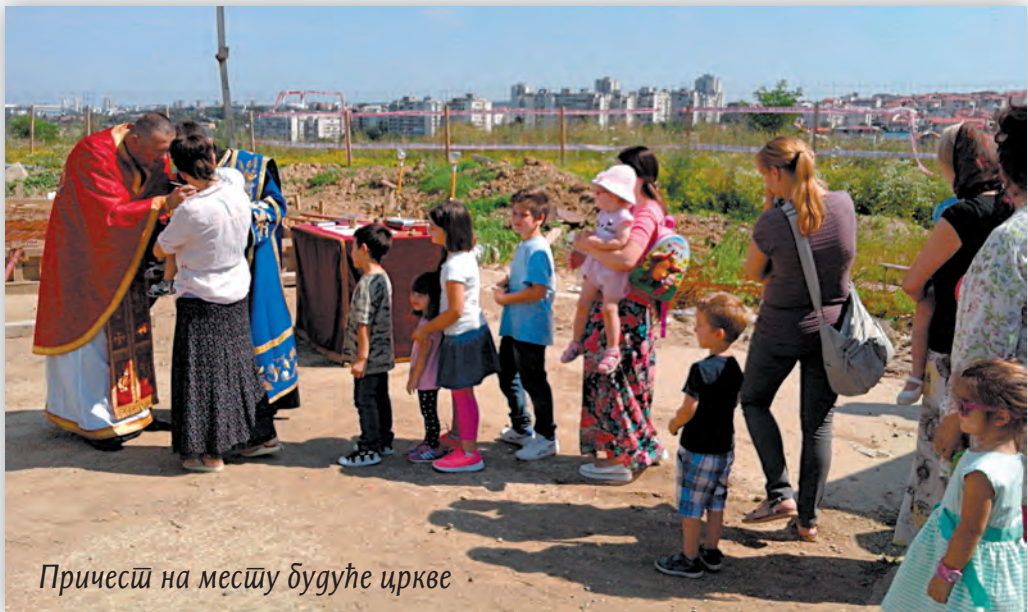
Причест на месту будуће цркве

...Стојим јуче и размишљам о мојих скоро тридесет година на западу, у Швајцарској. Становао сам у елитним насељима која ни мало не предњаче у односу на „Степу“. Многи би тамо пожелели овакво насеље. Наравно, не говорим о неким стварима као што је квалитет завршних радова или распоред у стану који би могао да буде бољи, или...Али, колико пара, толико и музике. Све остало, у срцу Београда, је боље од других делова града. Вели-