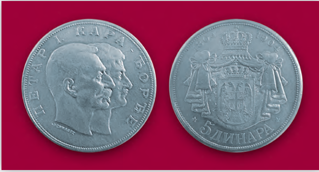
5 ДИНАРА Краљевине Србије из 1904. године