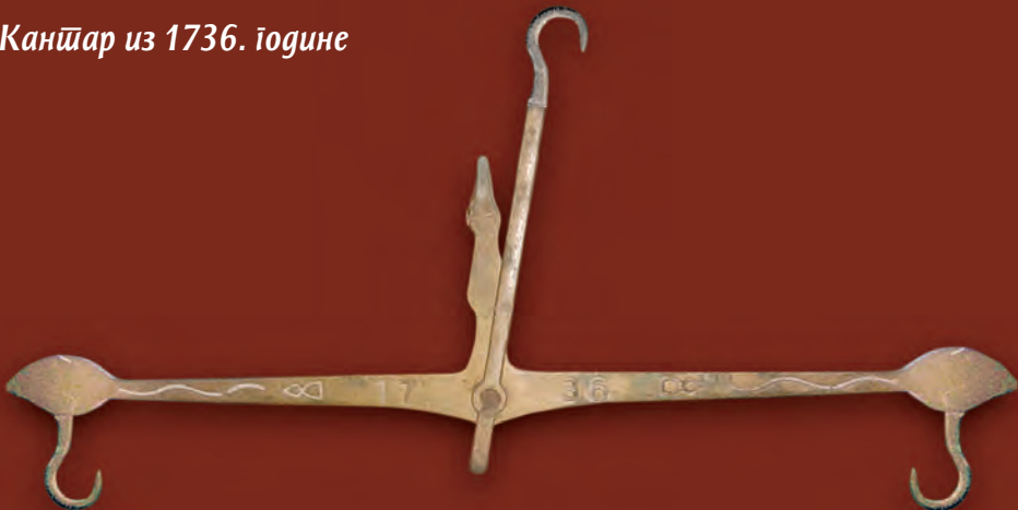
Канџар из 1736. године