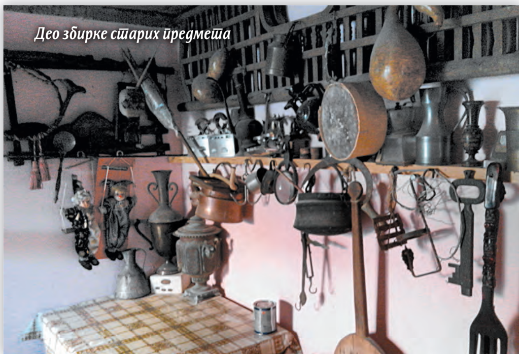
Део збирке старих предмета