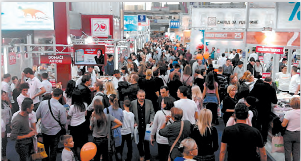
Београдски Сајам књига 2018. године

Годинама планирам да Међународни сајам књига у Београду посетим дан, два по отварању, средином недеље, када нема велике гужве. Али, увек има нешто прече, па се стално понавља да то буде субота уочи затварања. А ова, на Свету Петку, била је као да је судњи дан, као да је цео Београд и пола Србије некуд кренуло. Миле аутомобили у свим правцима кроз главни град, ништа боље није ни у близини и око сајмишта. Да ли је то био ђачки или студентски дан за обилазак 63. по реду сајма књига не знам, али је изгледало као да су све школске установе из Србије дошле баш ове суботе да разгледају шта то издавачи нуде. Било је као на „шабачком вашару“ осим што није трештала музика. Требало је стрпљења, прво да нађете штанд који вас интересује, а затим и да дођете на ред да погледате шта се то налази на пуним столовима. Био сам и љут и позитивно изненађен. Па кад ме је