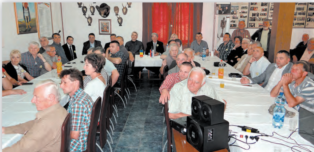
Пријатељи из Румуније са својим домаћинима у Лужницама

Тема овогодишњег сусрета је била и очување сакралних објеката Шумадије и Поморавља. Тим поводом приказан је филм о сакралним објектима овог краја од неолита до данас, при чему су представници Завода